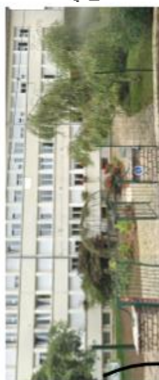
Site « Lycée » 5, rue aux loups 52500 FAYL-BILLOT